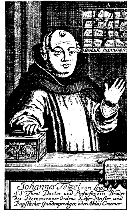
Num retraiio contemporâneo, Tetzel é mostrado cc de preços padrão para indulgências, e uma caixa receber o dinheiro.

indulgência voltasse ao banco como desconto pelo empréstimo feito a Alberto. Tetzel usava de métodos coercitivos para aumentar as vendas, prometendo até remissão do castigo temporal para os pecados mais graves se o pecador comprasse pelo menos uma indulgência 4 . A quantia solicitada dependia da riqueza e da posição social do pecador. O pobre a recebia gratuitamente, mas a um rei poderia custar cerca de 300 dólares. Foi o famoso protesto de Lutero nas 95 Teses contra o abuso das indulgências que precipitou a avalanche dos acontecimentos que resultaram na Reforma na Alemanha, que daí se espalhou por todo o norte e oeste da Europa.