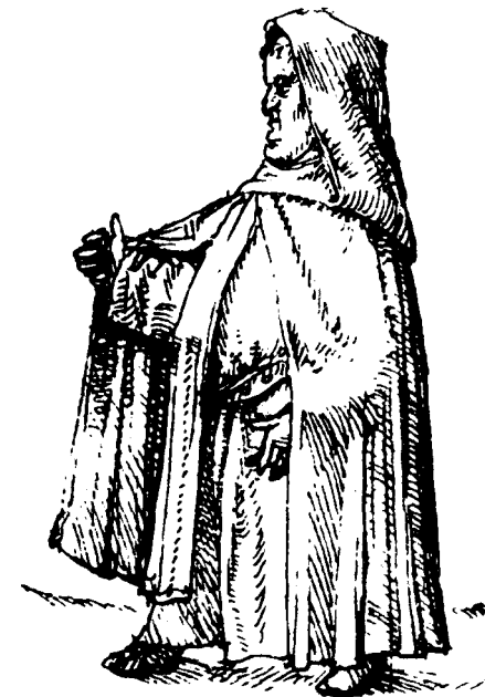
Hans Holbein, o jovem, fez xilogravuras como ilustrações para O Elogio da Loucura de Erasmo, uma sátira sobre os males da Igreja. Nas três aqui reproduzidas, Holbein representa um gordo monge, a alma de um monge entrando no corpo da Loucura, e umas pessoas adorando uma imagem.

Tanto no norte como no sul da Europa, a Renascença deixou resultados duradouros; O estudo do passado clássico pagão gerou um modo secular de viver, no