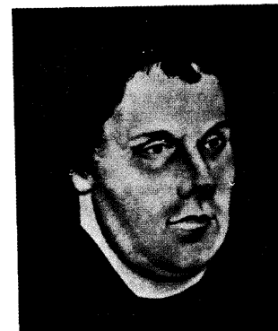
Lucas Cranach, o Presbítero, famoso pintor da Reforma, provavelmente, o autor deste retrato de Lutero. Ele foi pintado em 1526, após o casamento de Lutero com Catarina, uma ex-freira.

Após um breve período numa escola dos Irmãos da Vida Comum em Magde-burg, Lutero foi mandado para uma escola em Eisenach, ficando aí de 1498 a 1501.